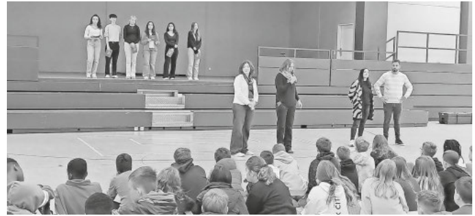
Kandidatenvorstellung und Begrüßung